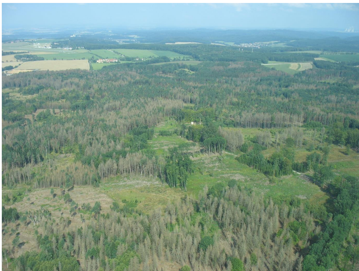
Mojský les – červenec 2018