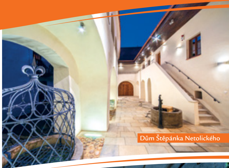
Dům Štěpánka Netolického