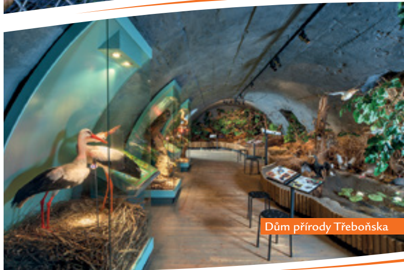
Dům přírody Třeboňska